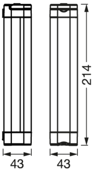
PGLINEAR LED TASK LIGHT 200MM IP54 WTMiPRCmnk